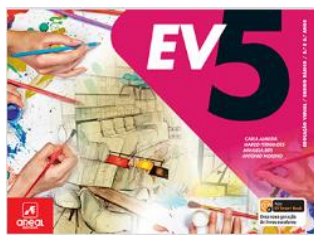
Manual (voucher - MEGA)